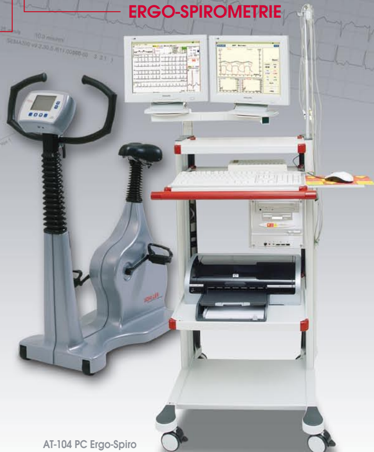
AT-104 PC Ergo-Spiro